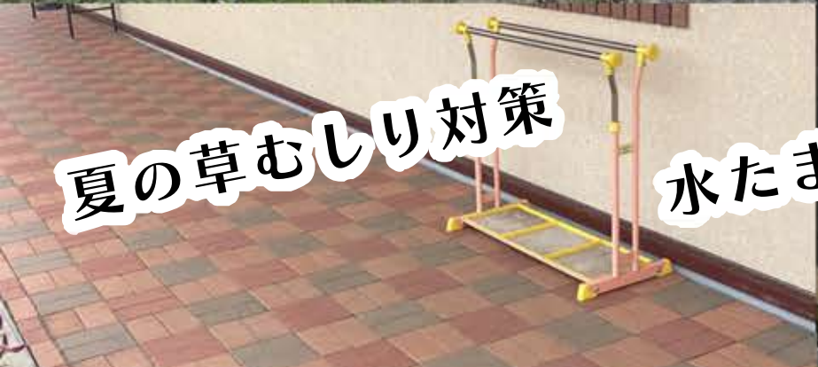
夏の草むしり対策