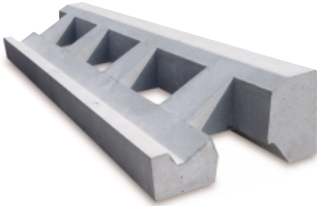
35 - 0 5 (控え350mm、勾配1 : 0.5用) 35 - 0 4 (控え350mm、勾配1 : 0.4用)